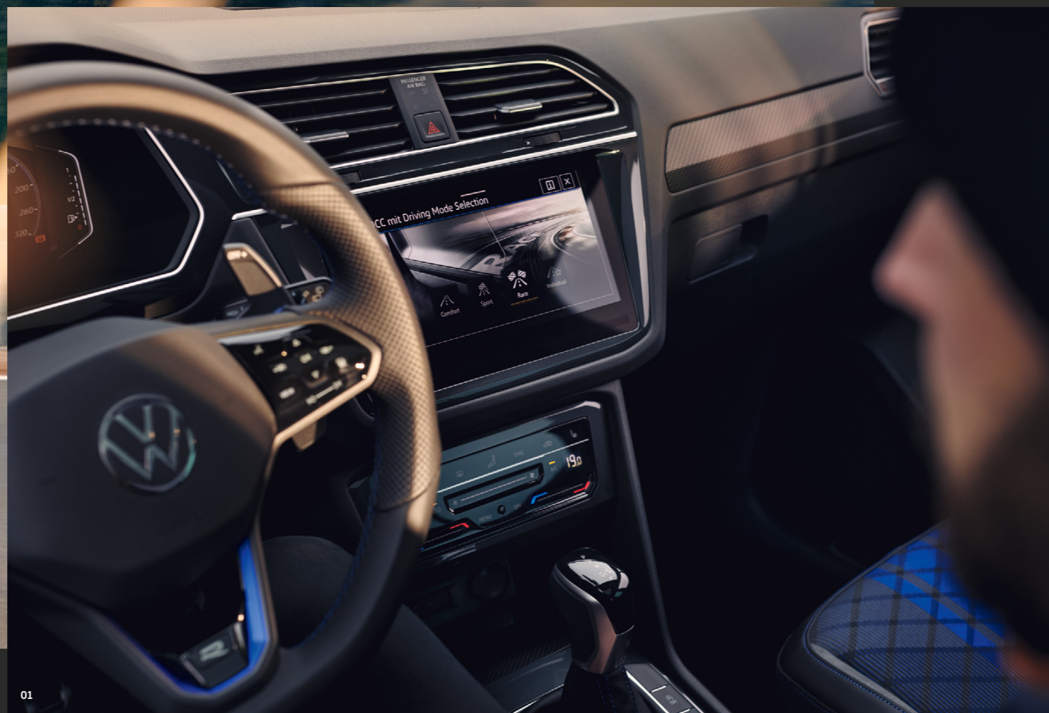
01 Die neue Lenkradgeneration mit Touch-Bedienung und einer extra R-Taste gehört ebenfalls zu den Highlights. Serienmäßig ist der Tiguan R mit dem „Digital Cockpit Pro“ und seinem 26 cm (10,25 Zoll) TFT-Farbdisplay sowie dem 20,3 cm (8 Zoll) Infotainmentsystem „Ready 2 Discover“ ausgestattet.

fest im Blick. Willkommen im schnellsten Tiguan aller Zeiten. Der Sportler kommt mit einem eigenständigen DCC-Sportfahrwerk mit zuschaltbarem Race-Mode, Progressivlenkung und einem neuen Allradantrieb: Das 4MOTION-System mit R-Performance Torque Vectoring bietet Ihnen ein neues Level der Fahrdynamik durch die variable Kraftverteilung auf den Hinterrädern, entwickelt von den Performance-Experten von Volkswagen R.